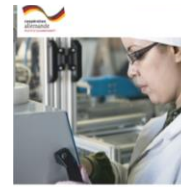
« L'emploi et l'entrepreneuriat féminin au Maghreb » Document d'orientation

L'appui à l'auto-organisation des femmes, outil de renforcement de la participation des femmes au développement ;